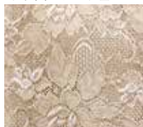
TC-220 ブラックスページュ