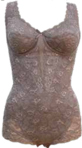
①ノンワイヤーボディースーツ