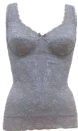
②ノンワイヤーボディシェイパー