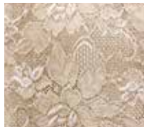
TC-220 ブラックスページュ